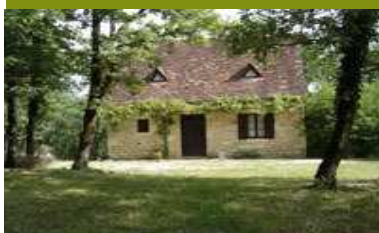
Dordogne (Montagnac d'Auberoche)

Prix: 250 € la semaine au lieu de 550 €. Soit 54 % de réduction!