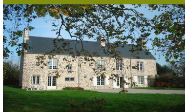
Manche (St Sauveur le Vicomte)

Prix: 250 € la semaine au lieu de 620 €. Soit 60% de réduction!