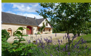
Côte d'Or (Source-Seine)

Prix: 200 € la semaine au lieu de 300 €. Soit 33% de réduction!