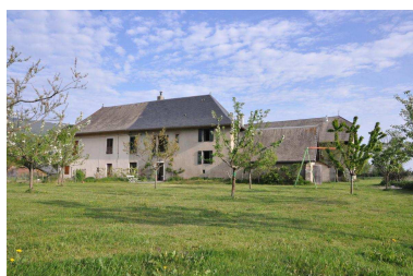
Savoie (St Sulpice)